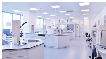
第三方检测实验室