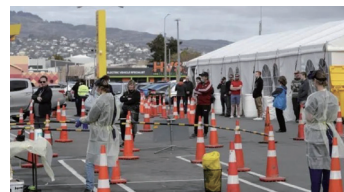
疫情突发地区筛查